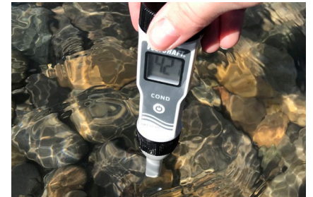
Figura 1: misurazione della conducibilità elettrica.