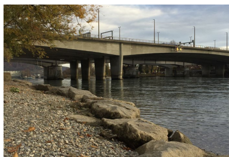
Figura 6: la postazione 2 (R2) lungo il Reno a Basilea.