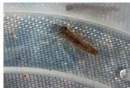
Figura 8: larva di plecoterio catturata nella postazione A1 (ulteriore punto di misurazione di GLOBE lungo l'Aare presso Berna).

Confrontiamo ora le nostre misurazioni per la verifica della plausibilità anche con i dati cantonali e nazionali: il punto di misurazione „Rhein Weil“ del sistema di misurazione NADUF e la postazione „Aare Bern, Dalmazbrücke“ del Laboratorio di protezione delle acque e del suolo del Canton Berna ci forniscono i dati più adatti (vedi figure 9 e 10). CN, CE e CO possono essere direttamente confrontati e mostrano che i nostri valori si situano in un intervallo paragonabile. In tal modo, le nostre misurazioni si rivelano nell'insieme molto plausibili. La plausibilità della QBA non può però essere ulteriormente verificata per mancanza di dati.