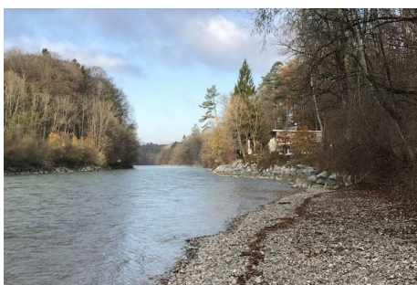
Figura 5: la postazione 1 (A3) lungo l'Aare a Berna.

Per avere una base di dati più grande possibile, rileveremo in questo esempio tutti i parametri delle offerte GLOBE „ Idrologia ” e „ Bioindicazione corsi d'acqua ”.