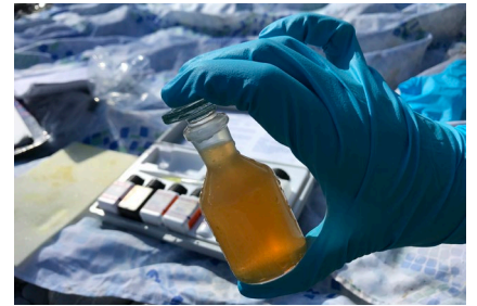
Figura 7: misurazione del contenuto di ossigeno.